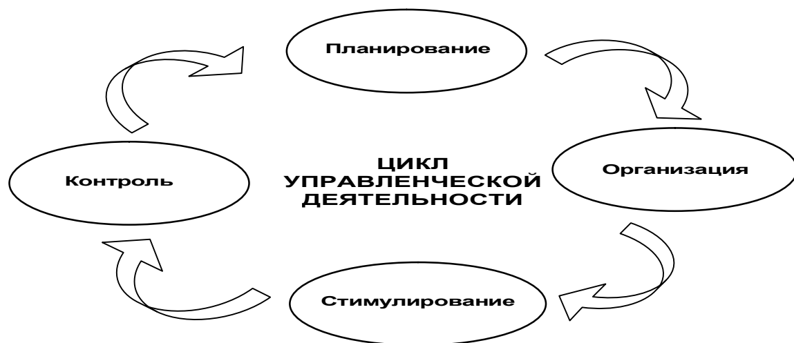
Рис. 2. Цикл управленческой деятельности

Функции управления. Выделяют четыре основные функции управления: планирование, организация, стимулирование и контроль. Непрерывная последовательность реализации этих функций составляет цикл управленческой деятельности (см. рис. 2).