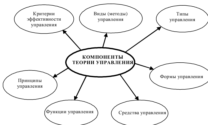
Рис.1. Компоненты теории управления

Зададимся вопросом – является ли деятельность педагога управленческой деятельностью? Да, безусловно. Педагог руководит обучающимся, управляет процессом его образования. Совершим краткий экскурс в общую теорию управления.